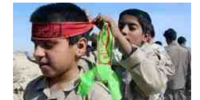
كۆمارى ئىسلامى و مەزھەبى كەردنى زياترى پەرۋەردە و بارھىتان