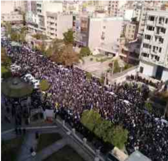
كۆبۈنەۋەي سەراسەرى مۇئەلىمان و پىۋىستى گۇرپانكارى لە چۈنەيتى بەرپۇە بردنى خۇپشاندا نەكان

رۇژنامەي شەھەرەۋەند ھەر لەم بوارەدا دەنوسىت: كور نرىك بە ۵۰ مىلۇن تەمەن، كچ نرىكەي ۷۰ تا ۸۰ مىلۇن تەمەن. قىمەتى مندال و كۆرپەلە زۆر جىاۋازن. كۆرپەلەكان لە مندالەكان گرانترن. بەسەرھاتى كۆرپەلەيەك كە پاش بەدىنا ھاتنى دەفرۇشرىت، بەسەرھاتىكى دلئەزىنە. واتە مندالانىك كە نەخۋازراۋ بەدىنا دىن تا بىنە پارىيەكى رەش و بۇ دايك و باۋكيان. دەسەلاتى ئىسلامى بەۋ ھەژارى و فەلاكەتەي كە بەسەر خەلكىدا