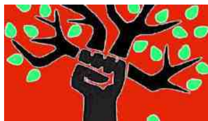
ماركسىزم و ئىكو سۇسالىزم