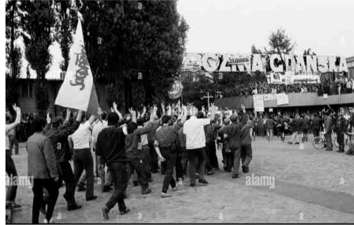
لە مەر مانگرتن