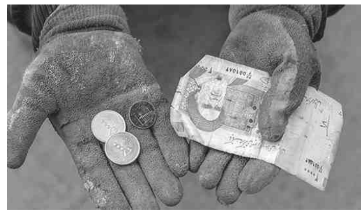
نەۋ كارەساتانەي كە دەسەلاتى ئىسلامى بەسەر خەلكى ئىرانى ھىناۋە