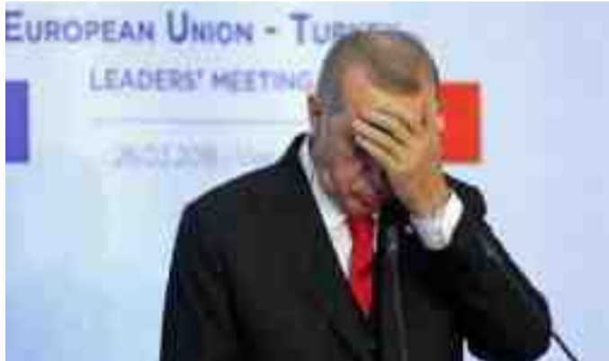
دەستى نەردۇغان خۇش بى، يان روى دىپلۇماسى دەۋلەتەكان رەش بى؟