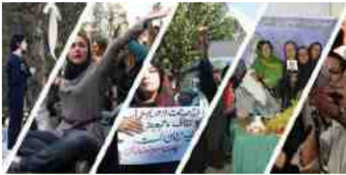
بزووتنەۋەي ژنانى ئىران، مۇتەكەي كۆمارى ئىسلامى