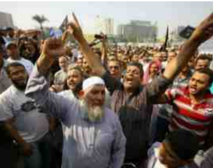
مىژوو و نىستاي سەلەفەيت لە رۇژھەلاتى كوردستان