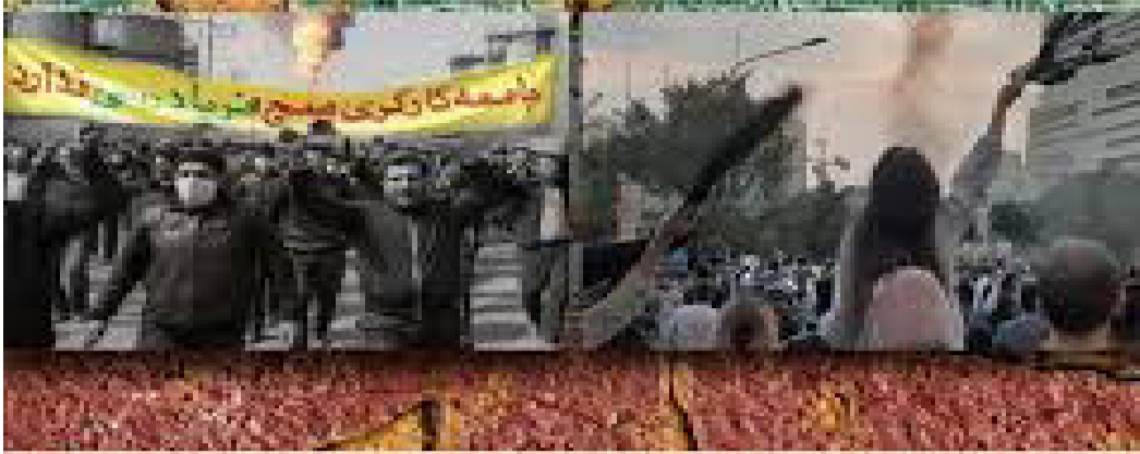
سەرلایمناوی ستراتیژی، مەملەتتی باندە حکوومەتیەکان، پێشپەرەیی ناخەری شۆرشگێرانی