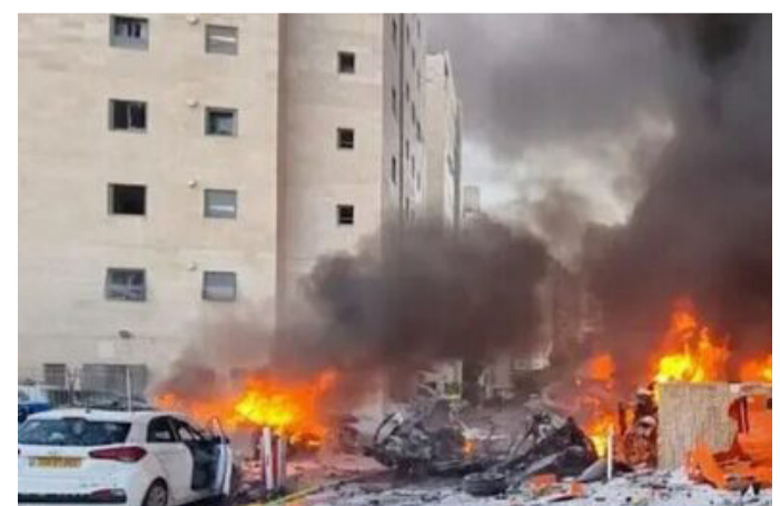
وته‌یه‌ک سه‌باره‌ت به‌ شه‌ر و تیکه‌له‌چوونه‌کانی نیوان ئیسرائیل و جه‌ماس